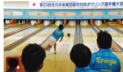
The Enagic International team fought hard through all 49 games. 49ゲームを投げ抜いたエナジックインターナショナルのチーム

The 33rd All-Japan Corporate Inter-City Bowling Championship (sponsored by Japan Bowling Congress Incorporated Foundation) was held over 3 days, beginning February 5. Enagic International, which was representing Okinawa, admirably finished as a runner-up in this large-scale event, that had a whopping 76 teams from 50 different cities (4 players per team) competing against each other.