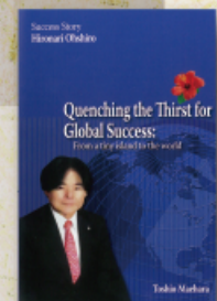
"Quenching Thirst for Global Success"