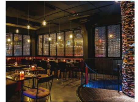
The exciting and fancy interior of the restaurant. 豪華な内装で客を待つ