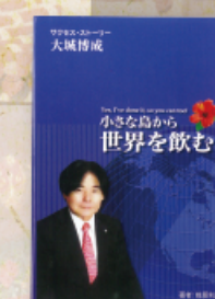
小さな島から世界を飲む!

「小さな島から世界を飲む!」エナジックの各支店または http://www.enagic.com で購入可