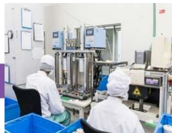
Departamento de producción de cartuchos.