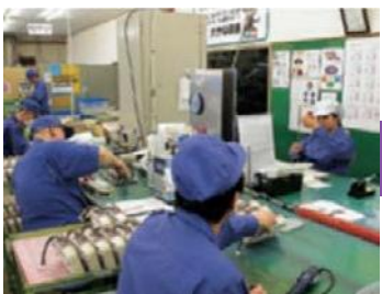
Línea de montaje de cámaras de electrólisis.