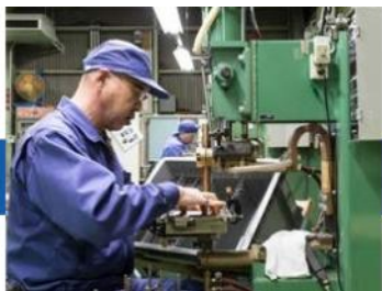
Departamento de procesamiento de prensa para placas de electrodos.

La fábrica de Osaka está ubicada en Hoshidakita, ciudad de Katano, en la parte noreste de la prefectura de Osaka. Es una gran instalación de producción que cubre más de 43,000 pies cuadrados tanto en el área del sitio como en el espacio general. Los componentes principales de nuestros productos, que incluyen todo, desde placas de electrodos hasta filtros internos, se fabrican en nuestra fábrica de Osaka. La fábrica se adhiere a los más altos estándares de fabricación y ha obtenido numerosas certificaciones de la Organización Internacional de Normalización (ISO), incluidas ISO9001, ISO14001 e ISO13485.