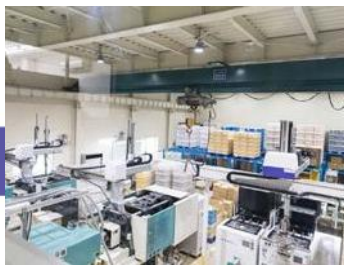
Lo último en inyección en máquinas de moldeo.