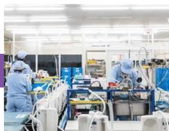
Línea de montaje principal.