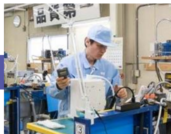
La prueba de pH también se realiza durante la prueba de flujo de agua en la línea de terminación.